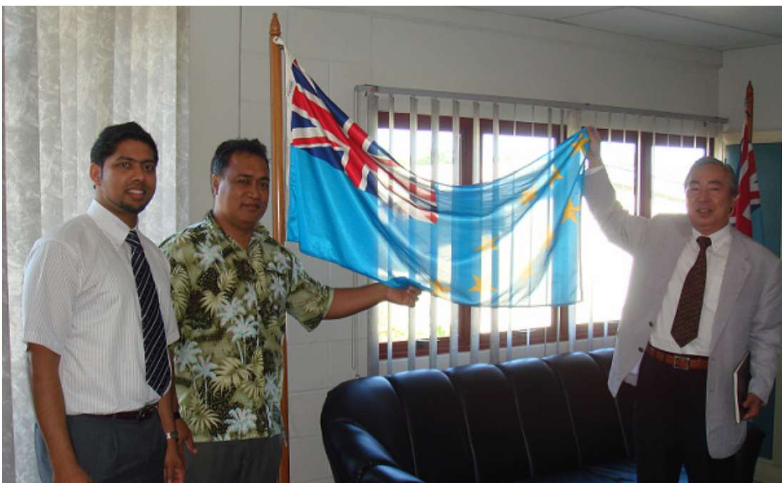
【同ツバル代表の方とのお写真】

ツバルは人口が 9,600 人、面積が 26 平方キロメートルで南太平洋のエリス諸島に位置する島国です。英連邦加盟国の一つであります。海拔が最高でも 5 メートルと低いため、海面上昇や地盤沈下がおこれば、国の存在そのものが脅かされる怖れがあります。