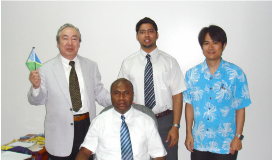
【同ソロモン諸島代表の方とのお写真】

ツバルは人口が 9,600 人、面積が 26 平方キロメートルで南太平洋のエリス諸島に位置する島国です。英連邦加盟国の一つであります。海拔が最高でも 5 メートルと低いため、海面上昇や地盤沈下がおこれば、国の存在そのものが脅かされる怖れがあります。